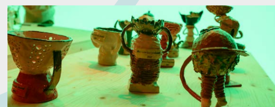
De Boei Kunst maakte een bijzondere trofee-familie